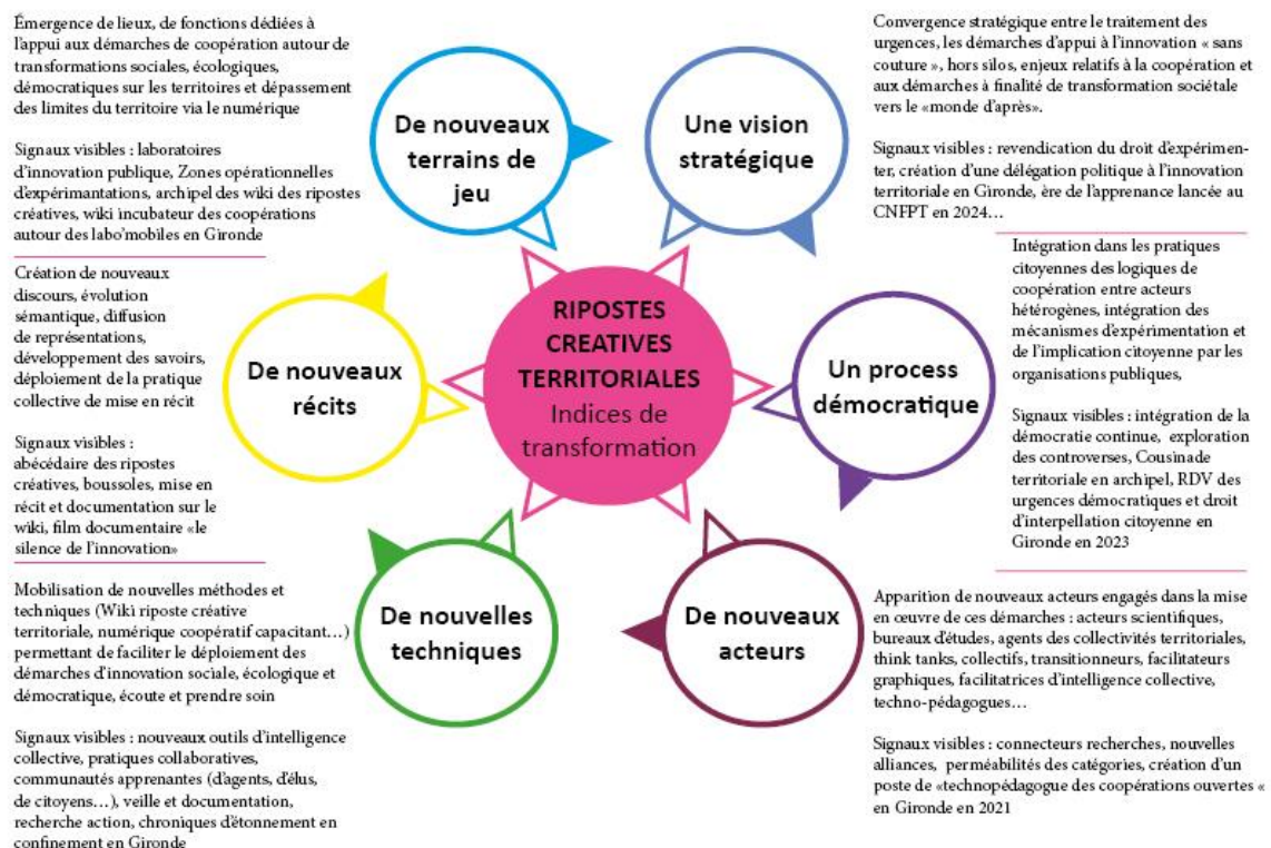
Schéma : Ripostes créatives territoriales. Indices de transformation

Avec quatre années de recul, il est possible d'appréhender l'expérience des Ripostes créatives territoriales à l'aune d'une grille de lecture 8 reprenant les conditions nécessaires à une transformation profonde (v. schéma ci-dessous).